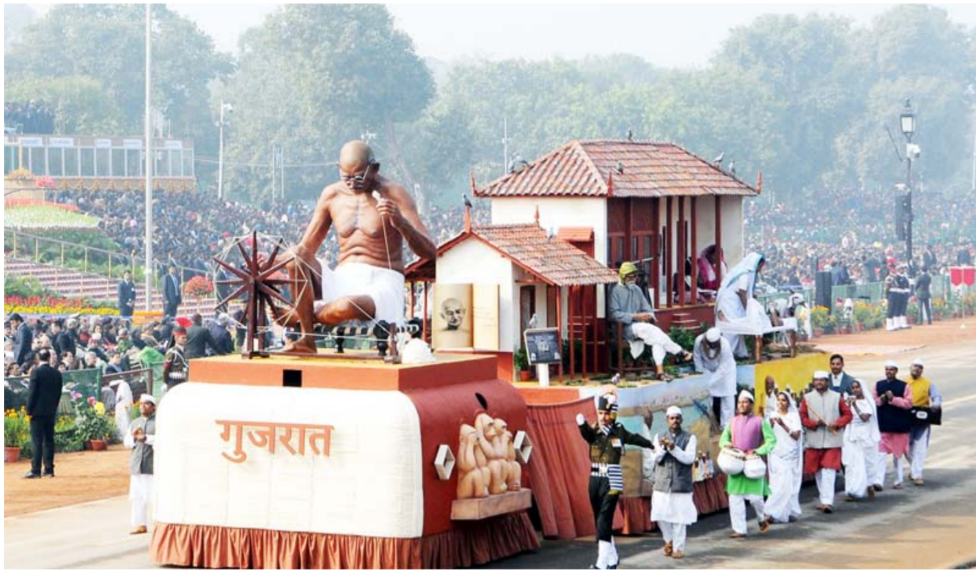
The tableau of Gujarat passes through the Rajpath, on the occasion of the 69th Republic Day Parade 2018, in New Delhi on January 26, 2018.